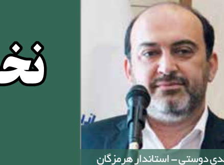
مهدی دوستی - استاندار هرمزگان

در ادامه سرپرست معاونت هماهنگی امور اقتصادی استانداری هرمزگان در این مراسم اظهار داشت: باید در کنار هم قرار بگیریم و به این نتیجه برسیم که باید تلاش کنیم مسیر کارآفرینی در استان آسان شود. علی فیروزی افزود: ظرفیت بسیار بالایی مانند زمین ها و سوله هایی که در شهرک های صنعتی استان هرمزگان وجود دارد باید در اختیار کارآفرینان اقتصادی در استان هرمزگان باشیم. وی خاطرنشان کرد: به زودی از سند استراتژیک توسعه استان هرمزگان رونمایی خواهد شد تا بتوانیم زمینه توسعه هر چه بیشتر این استان را فراهم نماییم. فیروزی گفت: در این سند مشوق هایی وجود دارد که بتواند برای کارآفرینان و مجاهدان عرصه اقتصادی راهگشا و موثر باشد تا زمینه ایجاد کسب و کار را آسان