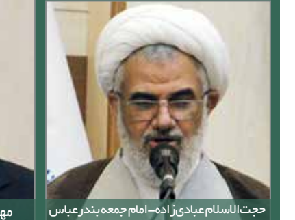
حجت الاسلام عبادی زاده - امام جمعه بندرعباس

زمانی که یک شغل و پیشه جدید به وجود می آید ادامه داد: به ویژه زمانی که انسان با نام و یاد خدا کار خود را آغاز می کند و تصمیم می گیرد که به فکر سرفه خالی مردم باشد. وی اظهارداشت: شما مظهر خلق آفریننده کار هستید و ارزش کار شما بسیار بالاست. امروز ما در یک جهاد همه جانبه ترکیبی از نسوی دشمنان این سرزمین هستیم. نماینده ولی فقیه در هرمزگان اضافه کرد: اقتصاد، امنیت و فرهنگ سه ضلع یک مثلث هستند که زمانی که کنار هم قرار می گیرند شما می توانید در یک جنگ ترکیبی از دشمن بیروز شوید. این مسئول گفت: ظرفیت های استان هرمزگان بسیار بالاست و باید از این ظرفیت ها برای ایجاد اشتغال و رونق کسب و کارها بهره گرفت. وی ادامه داد: باید از هنرهای استان هرمزگان محافظت کنیم و