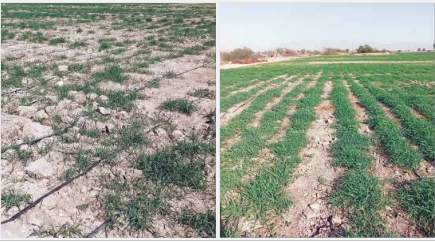
شهردار منطقه یک بندرعباس خبر داد