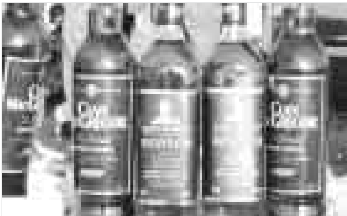
مشروبات الکلی، ۱۲ لیتر شراب کشف و یک فروند قایق موتوری توقیف شد.

ماموران پاسگاه ساحلی بزرگ شهرستان میناب در بازرسی از یک فروند لنج مخروبه در سواحل بزرگ تعداد ۴۵۳۶ قوطی مشروبات الکلی کشف و ضبط نمودند.