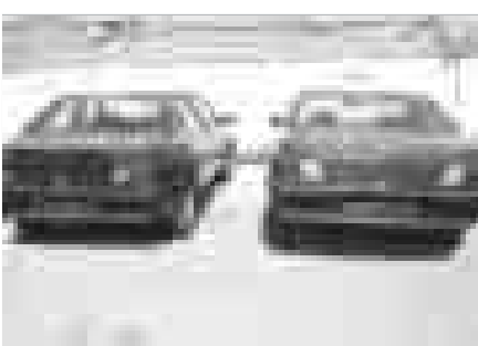
صورت بلاصاحب کشف و ضبط شد. و در بازرسی از خودرو ۲۷ کیلوگرم تریاک به

ماموران انتظامی پاسگاه شمیل از یکدستگاه پژو ۲۷۰ کیلو تریاک کشف نمودند.