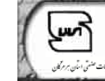
روابط عمومی اداره کل، مقامات و تحیت علمی ائمه علمای