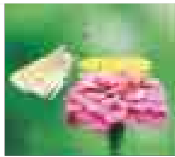
ناگفته های با خدا