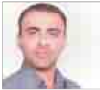
شناسنامه دار شدن بندر لنگه