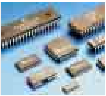
تراشه و جلوگیری از تصادفات

دوشنبه ۲۷ شهریورماه ۱۳۸۵ برابر با ۲۴ شعبان ۱۴۲۷ سال پنجم شماره ۳۴۱ ۸ صفحه ۵۰۰ریال روزنامه سیاسی، فرهنگی، اجتماعی، ورزشی