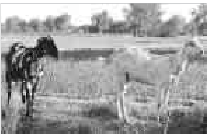
وادی سرگردانی ← وادی سرگردانی